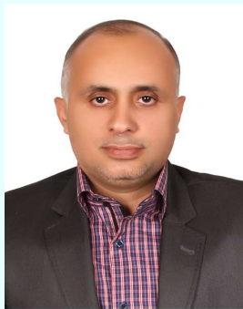
Baran Film 7591